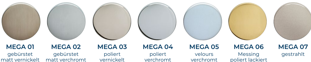
MEGA 01 gebürstet matt vernickelt MEGA 02 gebürstet matt verchromt MEGA 03 poliert vernickelt MEGA 04 poliert verchromt MEGA 05 velours verchromt MEGA 06 Messing poliert lackiert MEGA 07 gestrahlt

Die Grundmaterialien Messing und Zink eignen sich hervorragend um diverse Oberflächen gestalten zu können. Veredelte Metalloberflächen zählen zu den bedeutenden Ausdrucksmitteln der Architektur. Der einzigartige Finish vermittelt eine edle Dekoration, aber auch Nachhaltigkeit und feinste Handarbeit.