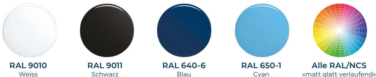
RAL 9010 Weiss RAL 9011 Schwarz RAL 640-6 Blau RAL 650-1 Cyan Alle RAL/NCS «matt glatt verlaufend»

Für unsere qualitativ hochstehenden Beschläge bieten wir eine umfangreiche Farbpalette an Pulverbeschichtungen an. Ob Firmenfarbe oder Trendfarbe oder die Farbe zur Aktivierung von Gefühlen gewünscht wird – für sämtliche Ansprüche ist ein Farbton vorhanden.