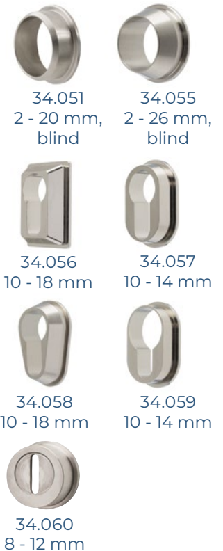
34.051 2 - 20 mm, blind